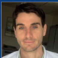
GUILLAUME DE BONNECAZE